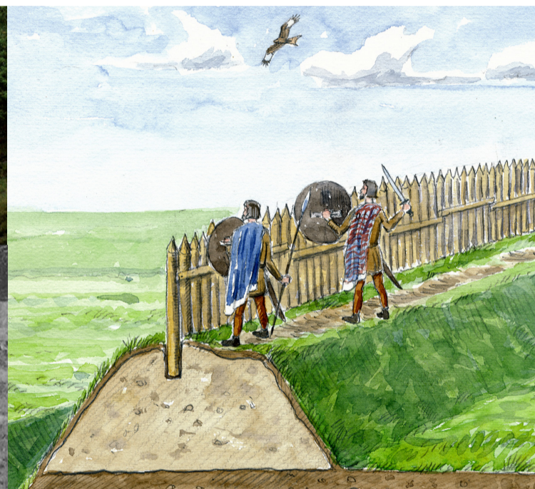
Udsigt over Rørbæk Sø.