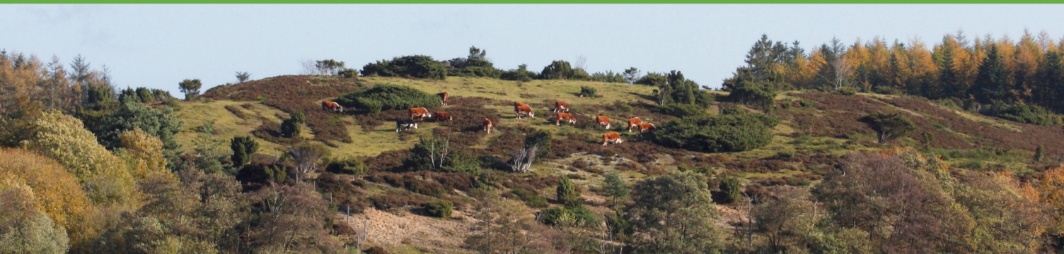
Græssende køer på overdrev og hede.