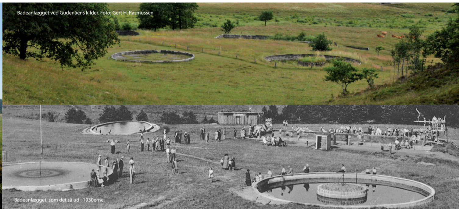
Badeanlægget ved Gudenåens kilder.