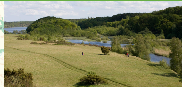
Gul rute nr. 2 på vej ind over Fårebanke.