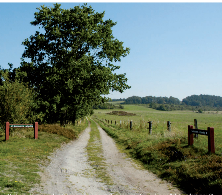
Midt i vandskellet og kun få hundrede meter til Skjernåens og Gudenåens udløb (vandretur nr. 8)

Udgivet af Naturstyrelsen Trekantsområdet og Vejle, Hedensted og Ikast-Brande kommuner juni 2011. Genoptrykt maj 2019.