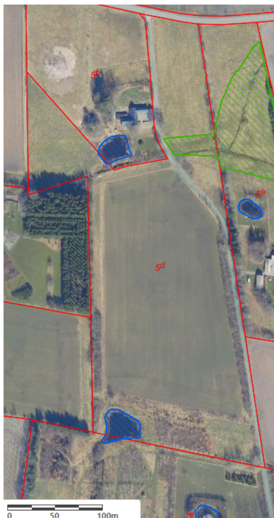
Oversigtskort med angivelse af beskyttet natur (Sø: Blå, eng: Grøn) og matrikelgrænser (rød).