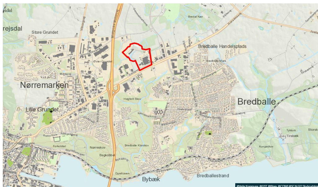
Placeringen af Fertin Pharma A/S, nord for Horsensvej i et industriområde