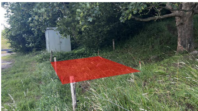
Figur 3: Trykreduktionsstation visualiseret med rødt