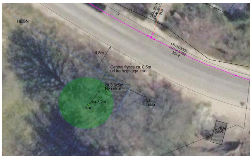
Figur 2: Skitse med indtegnet trykreduktionsstation på Høgsholtvej 19, 7100 Vejle

Der er indsendt skitse over huset og visualisering af placering af trykreduktionsstationen i forbindelse med, at Vejle Fjernvarme a.m.b.a har ansøgt om indsendt dispensationsansøgning til Natur og Udeliv.