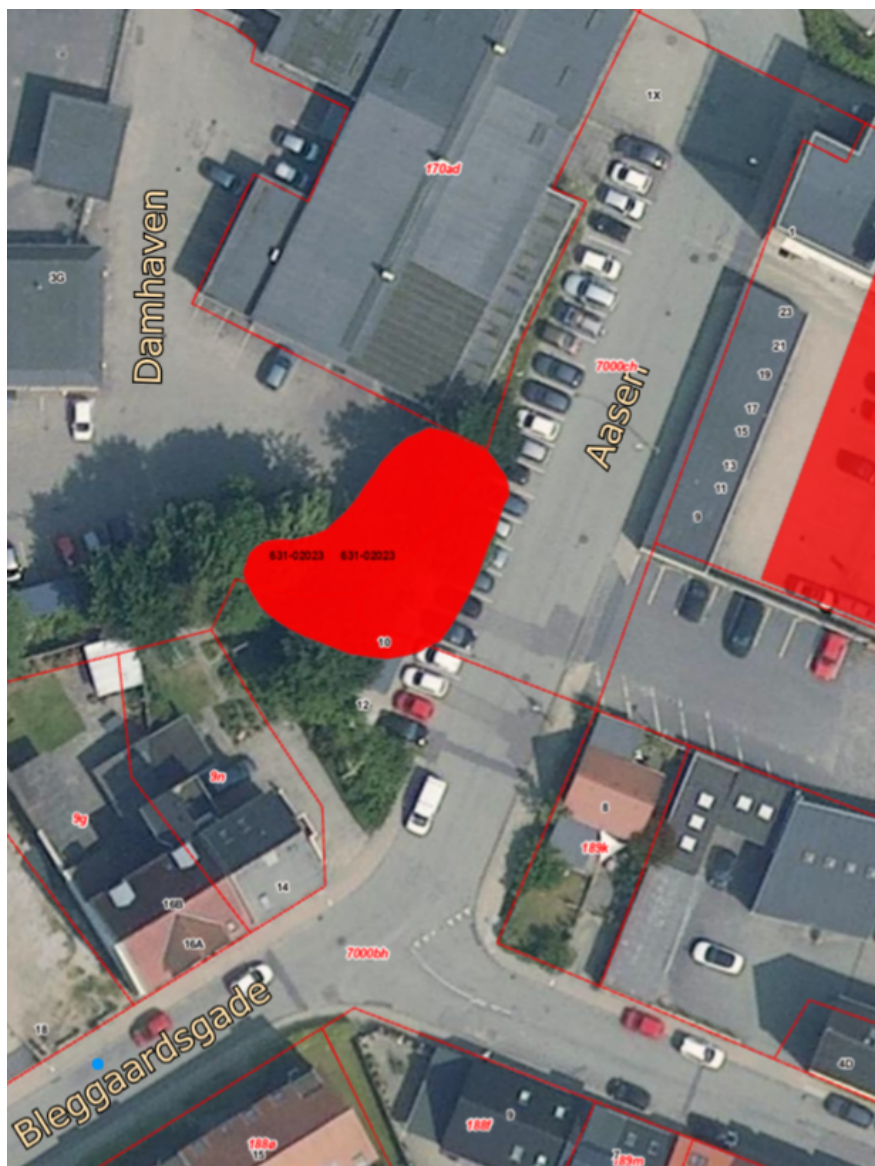
Figur 2: V2 kortlagt område