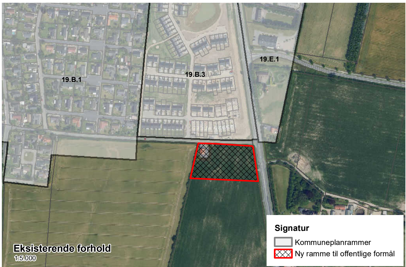
Figur 1 og 2 Tillægget udlægger en ny ramme syd for Søndermarksvej og vest for Fredericiavej.