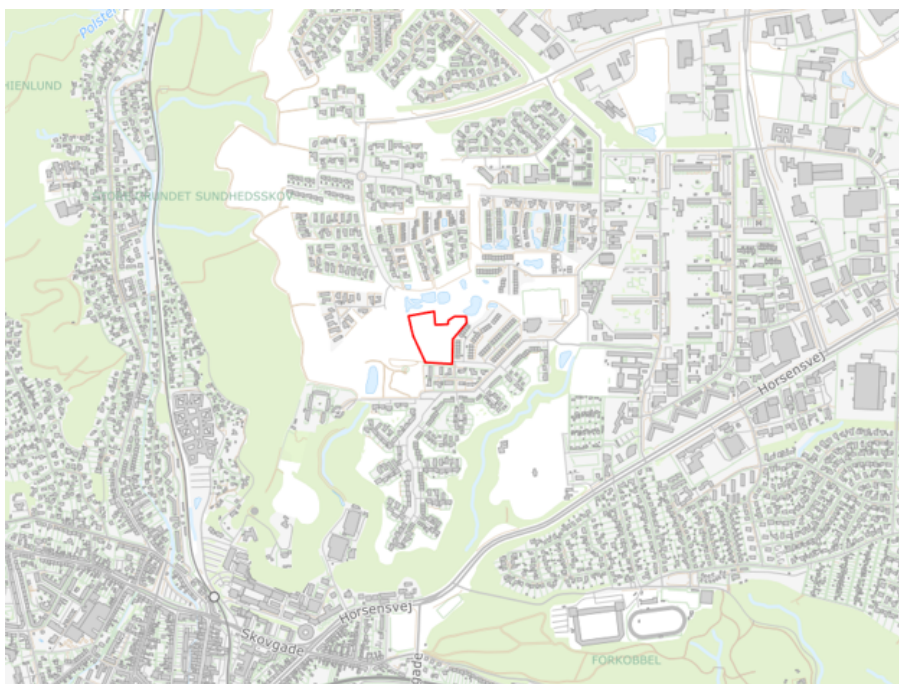
Figur 1 – Oversigtskort med projektområde, ikke målfast